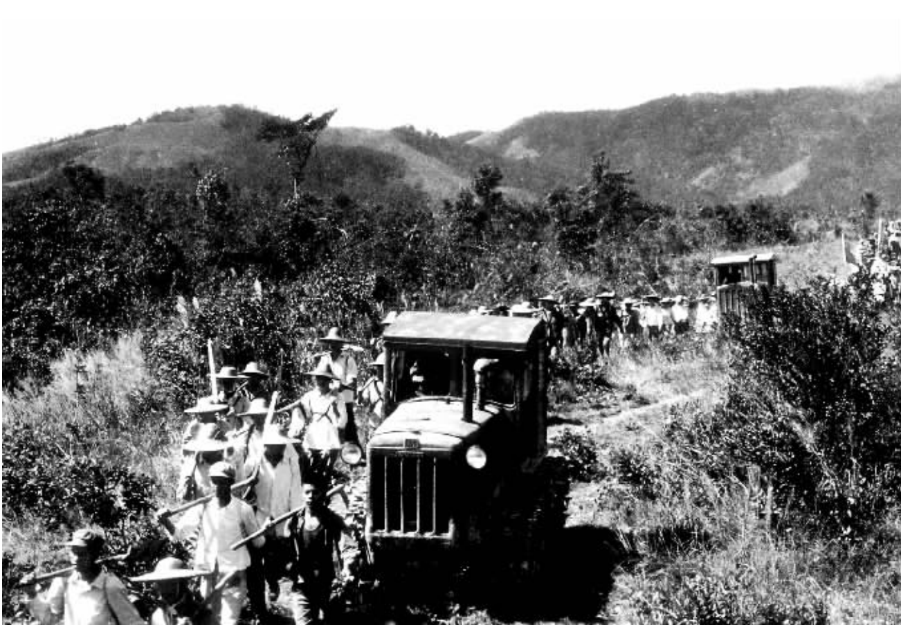
↑ 1974 年，海南第一个“大寨样板县”屯昌县的大寨专业队向荒山进军。 ➡ 1974 年，屯昌学大寨突击队员奋战雷公滩。