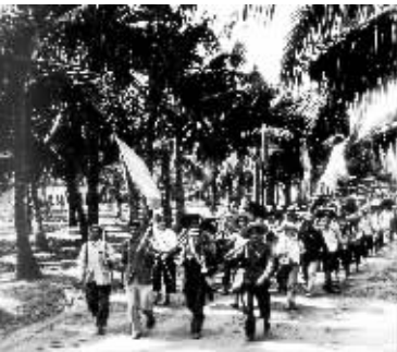
1974 年，屯昌干部带头下乡学大寨，赶木赖。