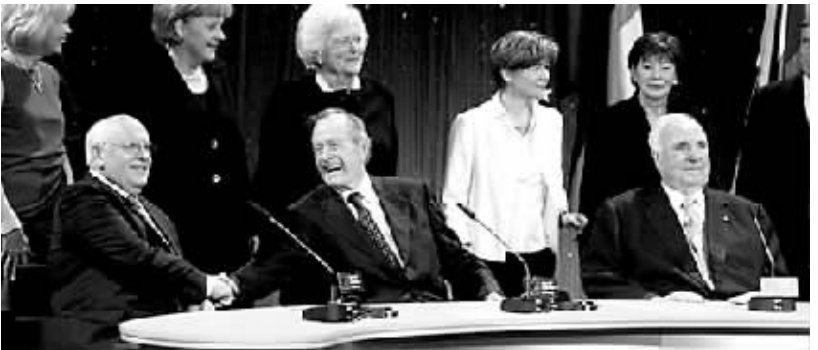
戈巴乔夫(前左一)老布什(前左二)科尔(前右一)参加庆祝活动。