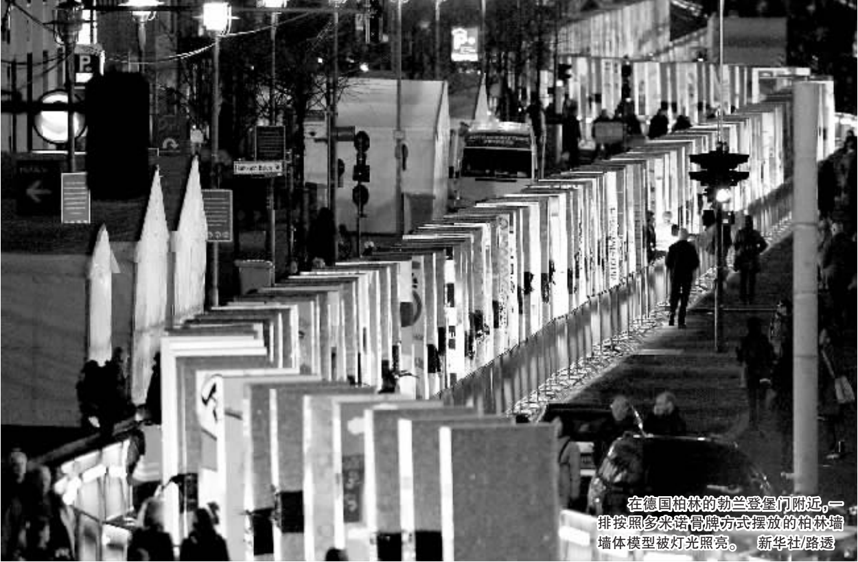
在德国柏林的勃兰登堡门附近,一排按照多米诺骨牌方式摆放的柏林墙墙体模型被灯光照亮。

10 万人目睹 1000 块巨型塑料多米诺骨牌组成的“柏林墙”倒塌过程,观看焰火表演