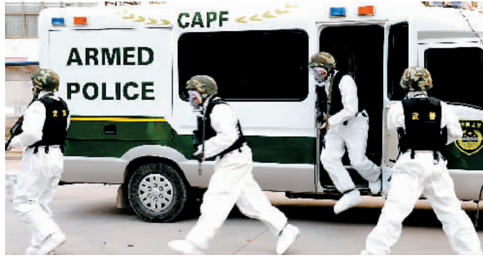
11月10日,武警战士在连云港市宿城乡演习现场对重要目标加强警卫。当日,国家核应急协调委员会举行首次核事故应急响应演习,以检验中国核应急预案及执行程序的有效性。此次演习模拟田湾核电站2号机组一回路主管道发生泄漏,放射性物质向环境释放。