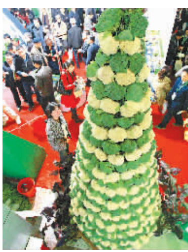
11月10日,为期4天的第六届届中国武汉农业博览会在武汉国际会展中心举行。展会上,一棵由西兰花和花菜组成的4米多高的“圣诞树”吸引了众多观众驻足参观。

《解释》明确规定对以下六种洗钱行为应当依法追究刑事责任:(1)通过典当、租赁、买卖、投资等方式,协助转移、转换犯罪所得及其收益的;(2)通过与商场、饭店、娱乐场所等现金密集场所的经营收入相混合的方式,协助转移、转换犯罪所得及其收益的;(3)通过虚构交易、虚设债权债务、虚假担保、虚报收入等方式,协助将犯罪所得及其收益转换为“合法”财物的;(4)通过买卖彩票、奖券等方式,协助转换犯罪所得及其收益的;(5)通过赌博方式,协助将犯罪所得及其收益转换为赌博收益的;(6)协助将犯罪所得及其收益携带、运输或者邮寄出入境的。