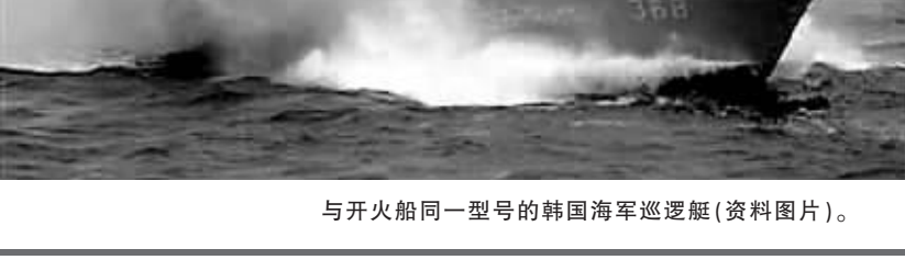
与开火船同一型号的韩国海军巡逻艇(资料图片)。

朝韩近年来主要冲突事件 1998年12月18日,韩国海军击沉一艘朝鲜微型潜艇并发现一名朝鲜海军军人尸体。 1999年6月,朝鲜和韩国海军在西部海域多次发生冲突,双方严重对峙。 2002年6月29日,双方海军舰艇在西部海域交火。韩国方面有4人死亡、1人失踪,20人受伤,并有1艘高速艇被击沉。朝鲜方面有1艘警备艇被击中起火。 2004年11月1日,韩国海军向3艘朝鲜巡逻艇开火。 2008年7月11日,一名韩国女游客在朝鲜釜山被朝鲜军人开枪打死。朝鲜方面说,她闯入了军事禁区并且没有听从警告。 (新华社专电)