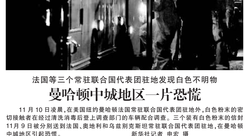
曼哈顿中城地区一片恐慌