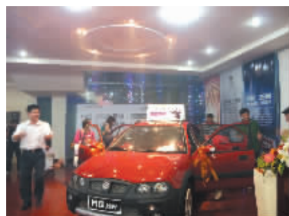
想体验1.4CVT澎湃动力,请到海南信达路康汽车销售有限公司。

新一代入门级“城市越野跨界车”——上汽名爵MG3SW黑骑士1.4CVT无极变速款豪华版正式上市,此次推出的新车继承了上汽名爵MG3SW一贯的野酷风格,更使“城市越野”理念与“野酷”文化获得了进一步的融合与发展,特别值得一提的是,该车是目前国内同级车中唯一配备欧洲进口CVT变速器的车型。MG3SW1.4CVT豪华款的推出,开启了国内城市越野跨界车市场的新时代。