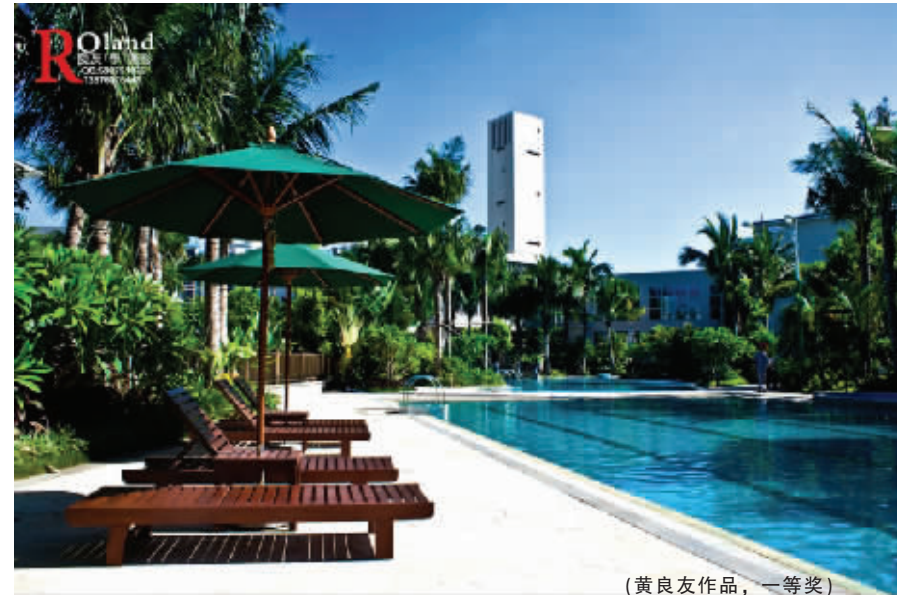
(黄良友作品，一等奖)