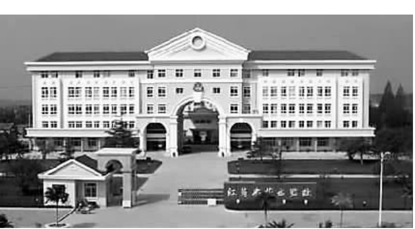
近日，有网友在网上发帖晒江苏、广东等地的7所豪华监狱。不少网友称，这样的监狱堪比高档小区，并质疑建设超标。上榜的几家监狱回应称，监狱建设按照国家标准建设，未超标。