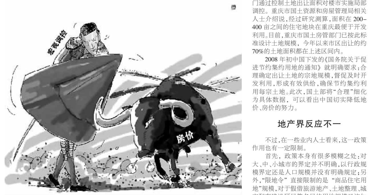
有业内人士指出,中国国土资源部发出“限地令”,是为了遏制近期“地王”频出现象,限制高地价、打击囤地。

日益攀高的中国地价有望在近期降温。中国国土资源部近日发出通知,对各类城市商品住宅项目单宗用地规模提出明确上限,“最大地块不得超过20万平方米”,被业内称为“限地令”、“地块限大令”。有业内人士指出,中国国土资源部此举是为了遏制近期“地王”频出现象,限制高地价、打击囤地。今年中国的房地产市场可用“炫目”来形容,许多城市的地价和房价让人看不懂。上半年很多城市的土地市场一片沉寂,半年时间全年土地出让面积尚未完成全年计划的十分之一,即使是地段好、环境佳的地块也“寂寂无闻”。可从下半年起,平地一声“惊雷”,“抢地”时代赫然来临。无论是一线城市还是二、三线城市,土地的拍卖价屡创新高,“地王”频频涌现。6月,中化方兴竞得北京广渠门15号地,土地面积15.59万平方米,楼面地价高达1.6万元,总价高达40.6亿元;9月,中海地产竞得上海长风地块,楼面地价攀上2.2万元/平方米,总额70.06亿元;11月,北京大龙房地产开发有限公司以50.5亿元拍下北京顺义天竺22号地,土地面积52.67万平方米,楼面地价每平方米逼近3万元……北京房地产界一位业内人士表示,“地王”频出的过程,就是少数房地产大鳄用“天价”提高房地产行业门槛、剥夺更多中小企业参与竞争机会的过程。大企业对于土地的垄断会造成小地产商无地开发的局面,最终会导致产品分层减少,低价房无市场,未来低端客户也许越来越难买到低价房。