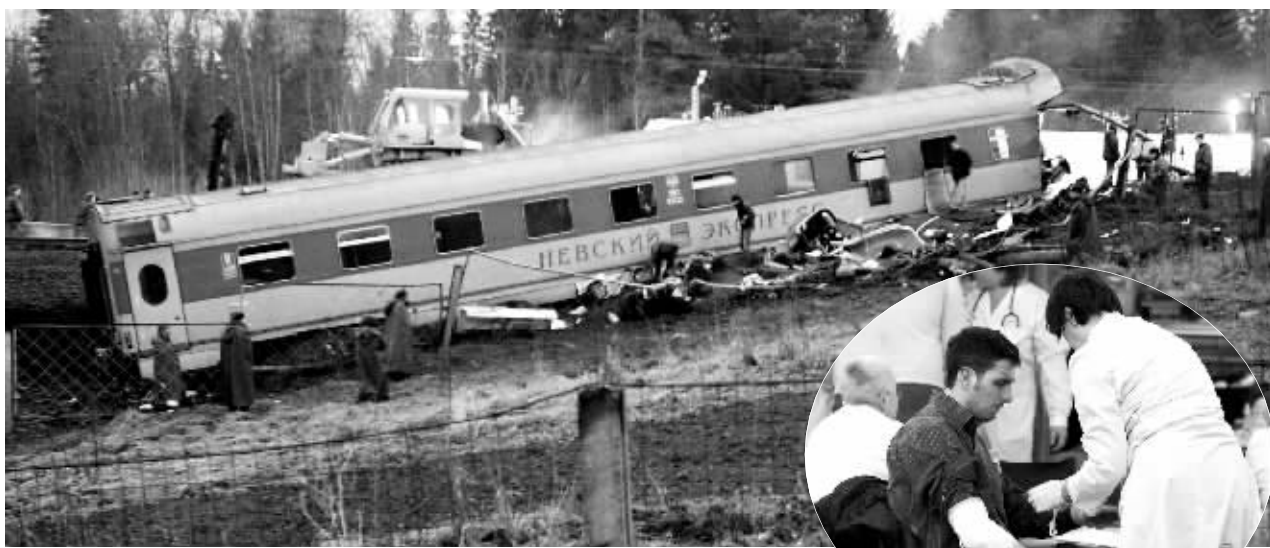
↑工作人员在列车出轨现场忙碌。 →出轨列车上的一名受伤乘客在俄罗斯圣彼得堡的一个火车站接受治疗。

多名伤员已被转移至圣彼得堡,其余伤员在当地进行救治。俄紧急情况部派出的一架运输机已抵达事发地,负责运送重伤员。从附近地区赶来增援的医疗小组也在事发当地开始工作。