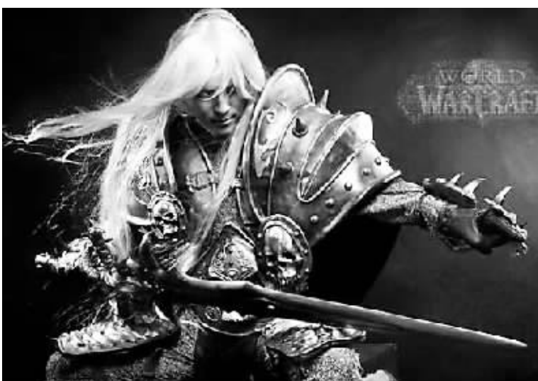
《魔兽世界》中的死亡骑士阿瑟斯