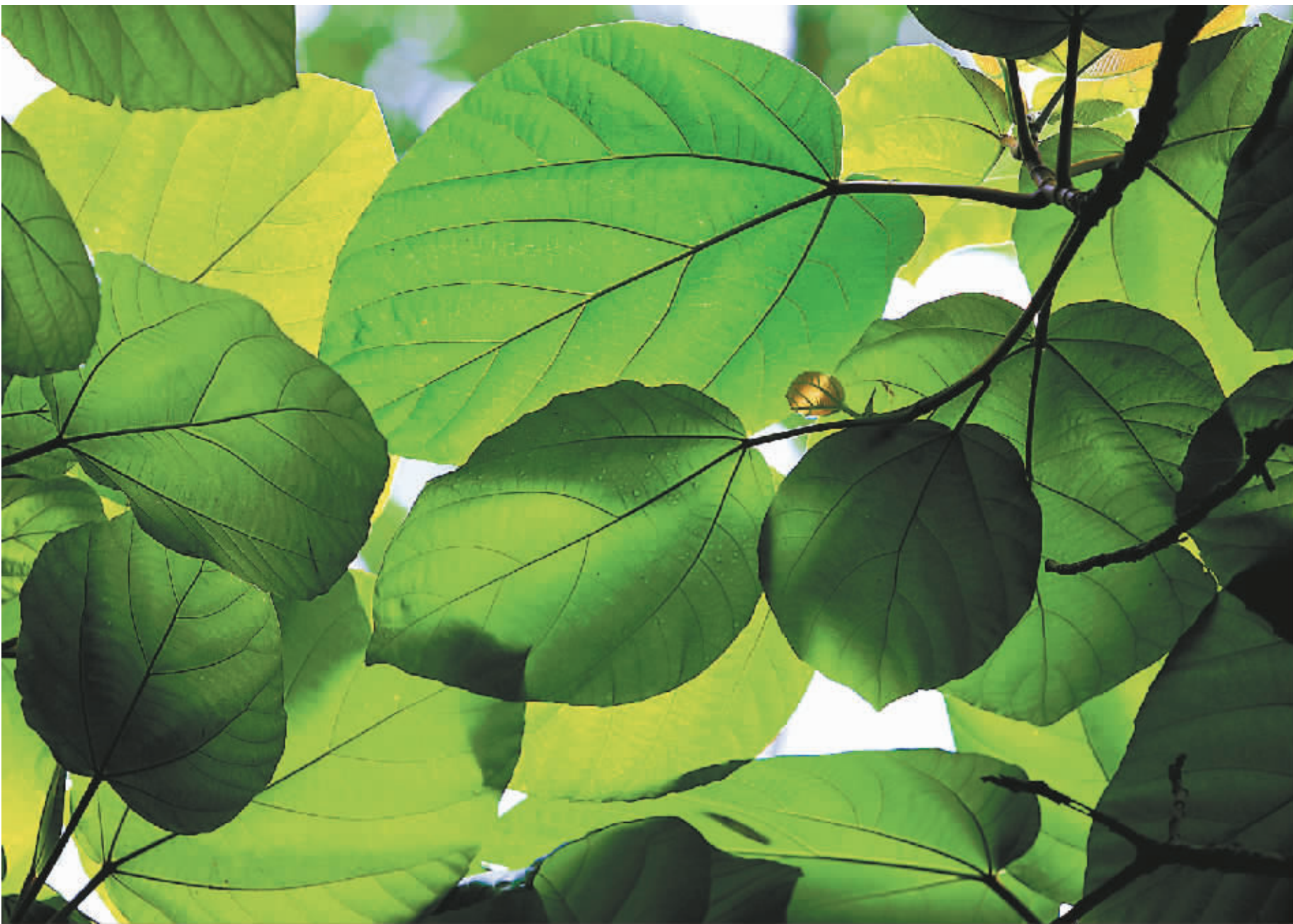
冬叶 (专业组)编号:Z1125028 拍摄时间:2008年5月19日 拍摄地点:五指山 光圈:F3.2 速度:1/200S ISO:320