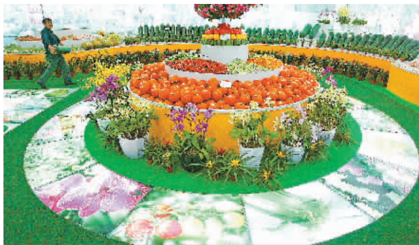
冬交会展展完毕,只待十二日开馆迎客。

本报海口12月11日讯(记者周月光)2010年,中国—东盟自由贸易区全面启动。对海南农业而言,是机遇多于挑战?还是挑战多于机遇?今天,本届冬交会组委会主办中国(海南)热带果蔬国际贸易企业家圆桌会议—东盟农业合作论坛,专家们认为,这给海南一个变劣势为优势、变边缘为中心的难得机遇。 2004年,中国—东盟自由贸易区初步实施,2006年,中国进口东盟6国(新加坡、马来西亚、泰国、菲律宾、印度尼西亚、文莱)的593种农产品关税降到零,到2010年,中国对东盟10国进口593种农产品全部实现零关税。 中国—东盟自由贸易区建成,对海南意味着什么?今天的论坛上,来自国内外的100多名专家学者、企业家、政府官员深入探讨了这一问题。 自2004年开始,海南农产品就开始受到东盟各国农产品进口的影响,但中国海关数据显示,海南农产品出口,不但没有下降,反而保持大幅增长态势。据分析,