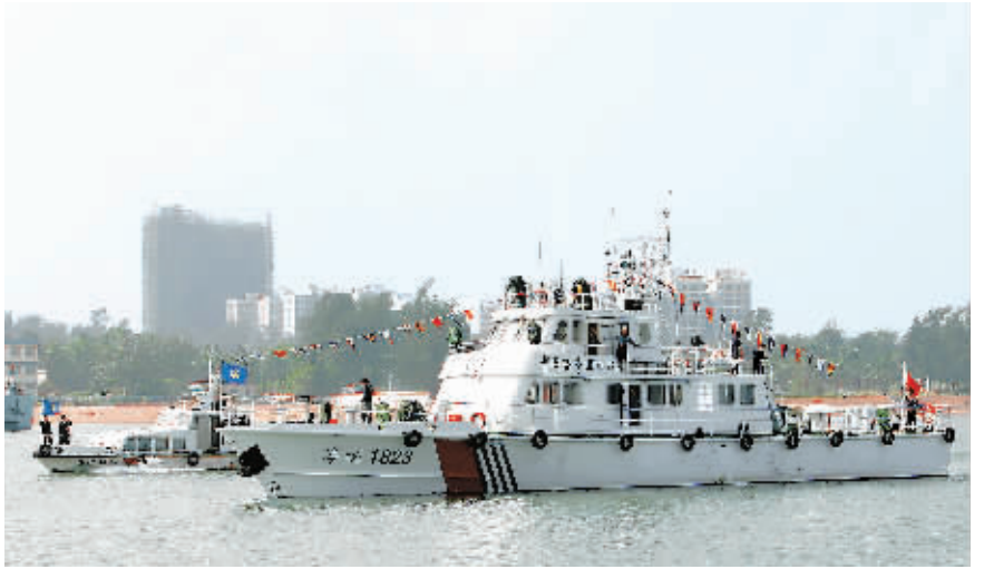
12月11日,经过11天的航行,新下水的海事巡逻船“海巡1823”顺利抵靠海口港海事码头,正式交付南海海警局。该船列编南海海警局后,将进一步提高南海对沿海及近海海域的监管能力,增强水上安全保障。