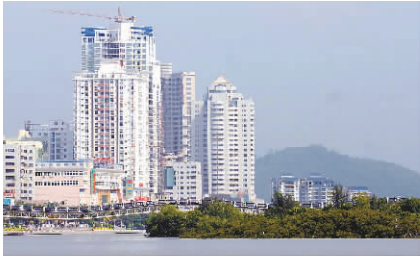
矗立在三亚河畔的商品房。

本报三亚12月14日电(记者刘寅见 见习记者蒋波)三亚的房子是不是涨得太快?三亚的房子是不是已经卖光了?近日,三亚房地产业盛传“两大传言”。今天,三亚市住建局分析房地产市场监测数据透露,今年前11个月三亚平均房价是每平方米9956元,基本与去年持平。