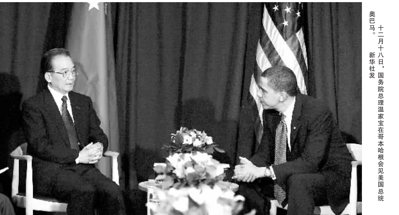
十二月十八日,国务院总理温家宝在哥本哈根会见美国总统奥巴马。

新华社哥本哈根 12 月 18 日电 国务院总理温家宝 18 日在哥本哈根会见了美国总统奥巴马。 温家宝表示,气候变化是全球性挑战,也是中美两国合作的重要领域。应对气候变化,关键是坚持“共同但有区别的责任”原则。中国政府宣布了控制温室气体排放的目标,体现了积极应对气候变化,与国际社会携手应对挑战的诚意和决心。我们自主采取减缓行动,并受国内法律和舆论监督。在有关信息的披露方面,我们愿积极开展国际交流对话与合作。中方对美国作出向最不发达国家提供融资支持的承诺表示欢迎,关键是采取切实行动,帮助发展中国家应对气候变化。中方愿与美方加强沟通与协商,增进互信,推动会议取得公平、合理、可实现成果,向世界传递希望和信心。 奥巴马表示,应对气候变化,应遵循“共同但有区别的责任”原则。中国宣布的控制温室气体排放目标是雄心勃勃的,令人印象深刻,这对世界很重要。中国是发展中国家,面临的巨大挑战是发展经济、消除贫困,不能苛求中国采取美国等发达国家应采取的步骤。美方对中方愿增加自主减排信息的透明度表示赞赏,愿同中方共同推动哥本哈根会议取得成果,并加强在气候变化领域的长期合作。