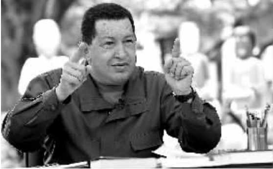
12月20日，委内瑞拉总统查韦斯在首都加拉加斯发表每周例行电台讲话。

委内瑞拉总统乌戈·查韦斯20日说，一架美军无人侦察机从哥伦比亚起飞，侵入委内瑞拉领空从事间谍活动。他说，委内瑞拉眼下时刻防备可能来自哥伦比亚的军事袭击。