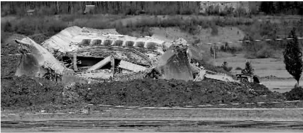
这是位于格鲁吉亚第二大城市库塔伊西的第二次世界大战纪念碑的破坏现场。

格政府原计划于21日炸毁这座纪念二战阵亡格鲁吉亚将士的纪念碑，然后在原地建格议会大楼，格议会部分职能和办公机构将从首都第比利斯迁往该大楼。格政府的这一计划遭到反对党和部分民间组织的抗议。据悉，格政府提前炸毁纪念碑与抗议活动有关。