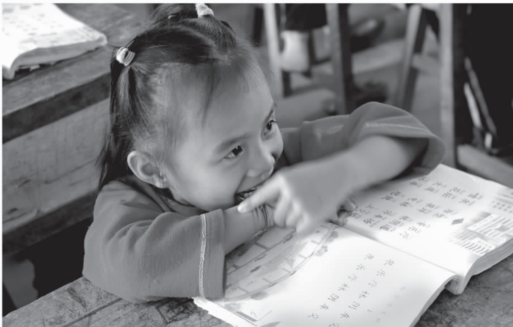
七叉小学，这个小女孩在开心地听老师讲课。