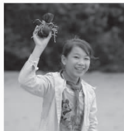
在王下小学，学生游戏时间玩的是自制的沙包。