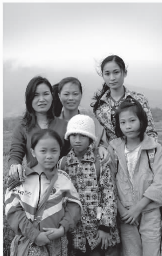
七叉小学，这些女教师的青春都奉献给了山里的孩子。