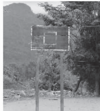
王下小学简陋的篮球架。