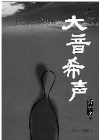
《大音希声》 辽宁教育出版社 2009年10月 符兴全 著

《大音希声》描写之细腻传神可谓精彩之至,充分展露出小说作者磅礴充盈的人物心理刻画能力和非凡的语言调遣能力。