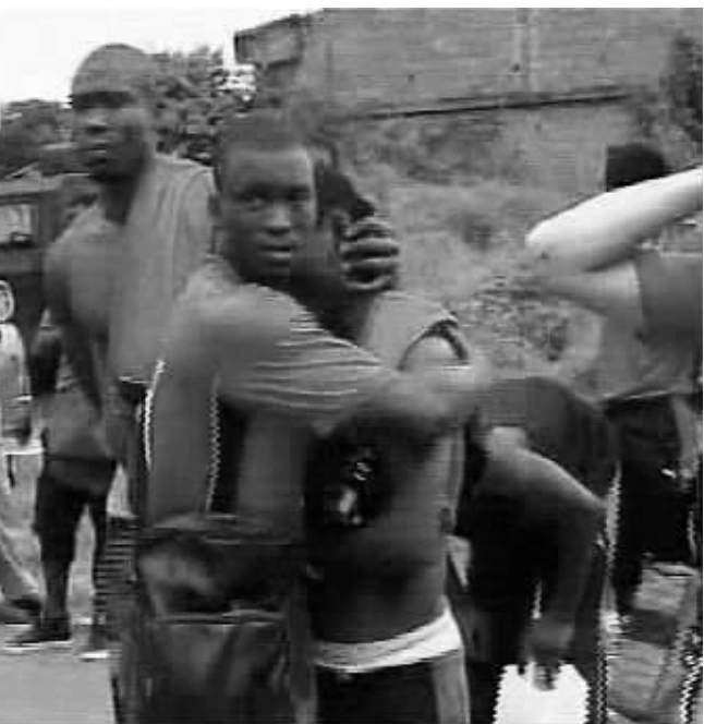
多哥国家队成员在事件发生后相互安慰(安哥拉电视台截图)。新华社发