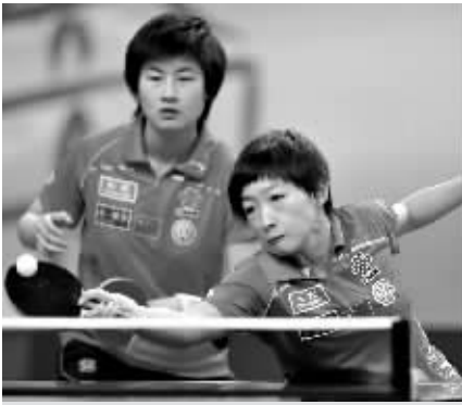
丁宁/刘诗雯(右)在比赛中。

“这次双打只有我和丁宁一对,肩负的责任还是比较大的,最后能完成任务还是比较高兴,”刘诗雯说,“但是对我来说,回去还是要好好总结。”