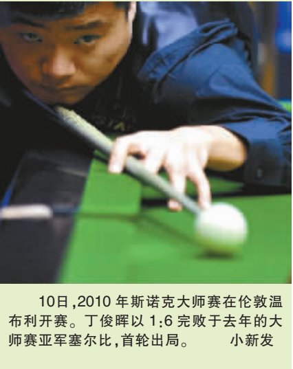
10日,2010年斯诺克大师赛在伦敦温布利开赛。丁俊晖以1:6完败于去年的大师赛亚军塞尔比,首轮出局。小新发