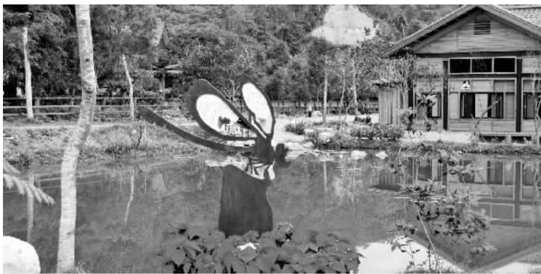
地震废墟上建起的台湾南投桃米生态村,处处体现创意。

海南建设国际旅游岛帷幕已经拉开,休闲农业作为国际旅游新潮流必将迎来大发展。而发展休闲农业,台湾已经有几十年历史,不仅拓展了现代农业的新空间,还积累了丰富的经验。海南推进热带农业现代化,特别是促进国际旅游岛建设,台湾发展休闲农业的经验是一笔宝贵的财富,可资借鉴之处颇多。