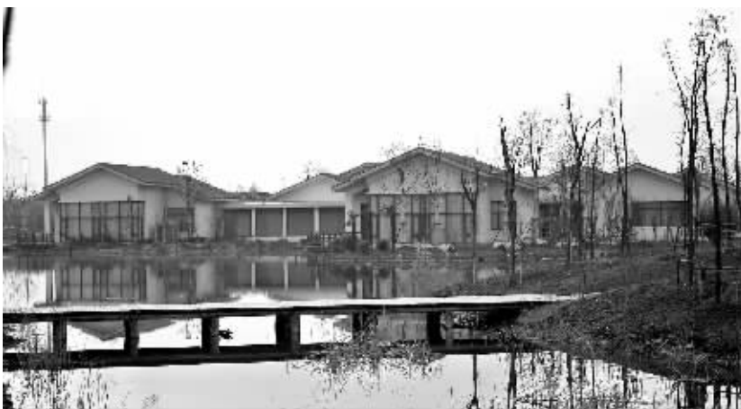
村前会馆远眺。

杨建平:“公共管理用房”并没有明确限定它的具体功能。我们理解,办配套的吃饭场所或者游客中心都是可以的。而且建园的时候,我们也考察过不少地方,大