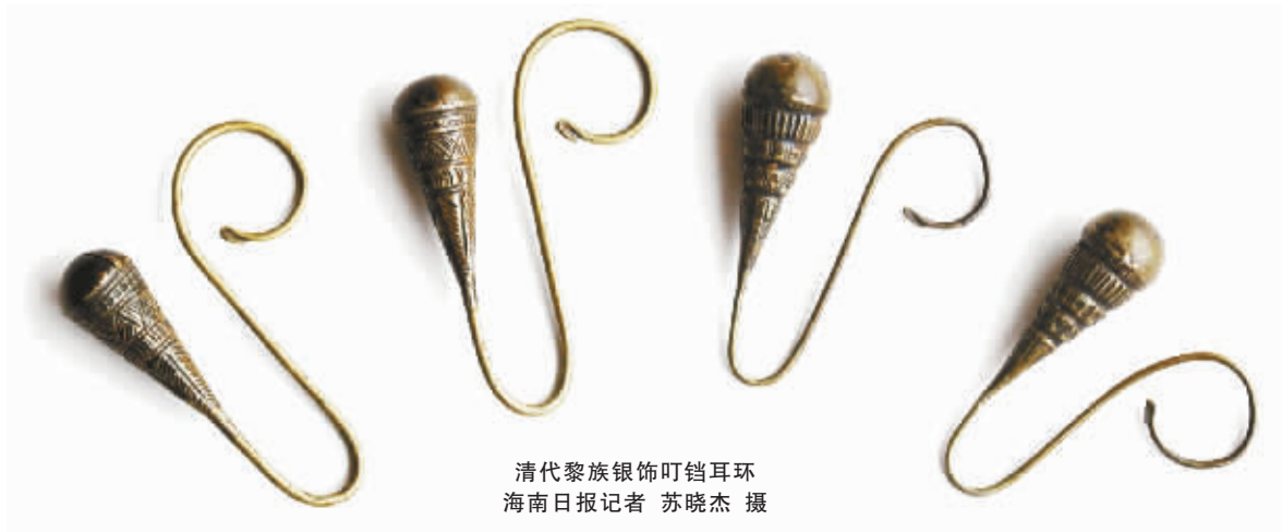
清代黎族银饰叮铛耳环