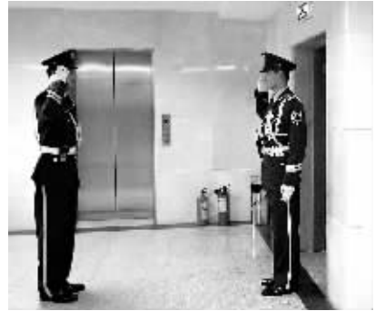
忠于职守 1月26日,在省人大大会堂分组会议室内,两名武警战士在交接岗。