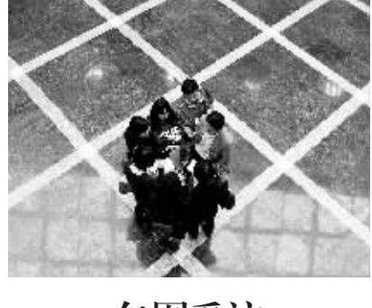
包围采访 1月26日,在分组审议会场,几家媒体记者抓住代表审议休息时间紧张采访。