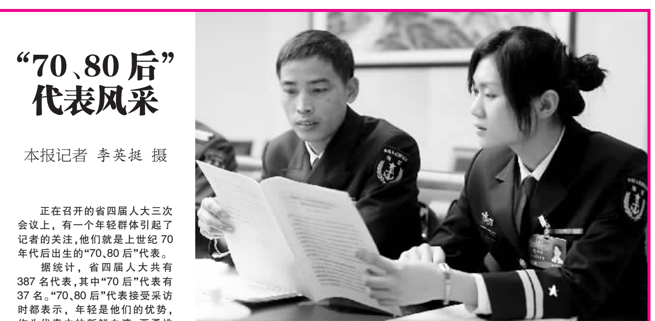
正在召开的省四届人大三次会议上,有一个年轻群体引起了记者的关注,他们就是上世纪70年代后出生的“70、80后”代表。 据统计,省四届人大共有387名代表,其中“70后”代表有37名。“70、80后”代表接受采访时都表示,年轻是他们的优势,作为代表中的新鲜血液,要勇挑重担,切实履行职责,发挥人大代表的作用。