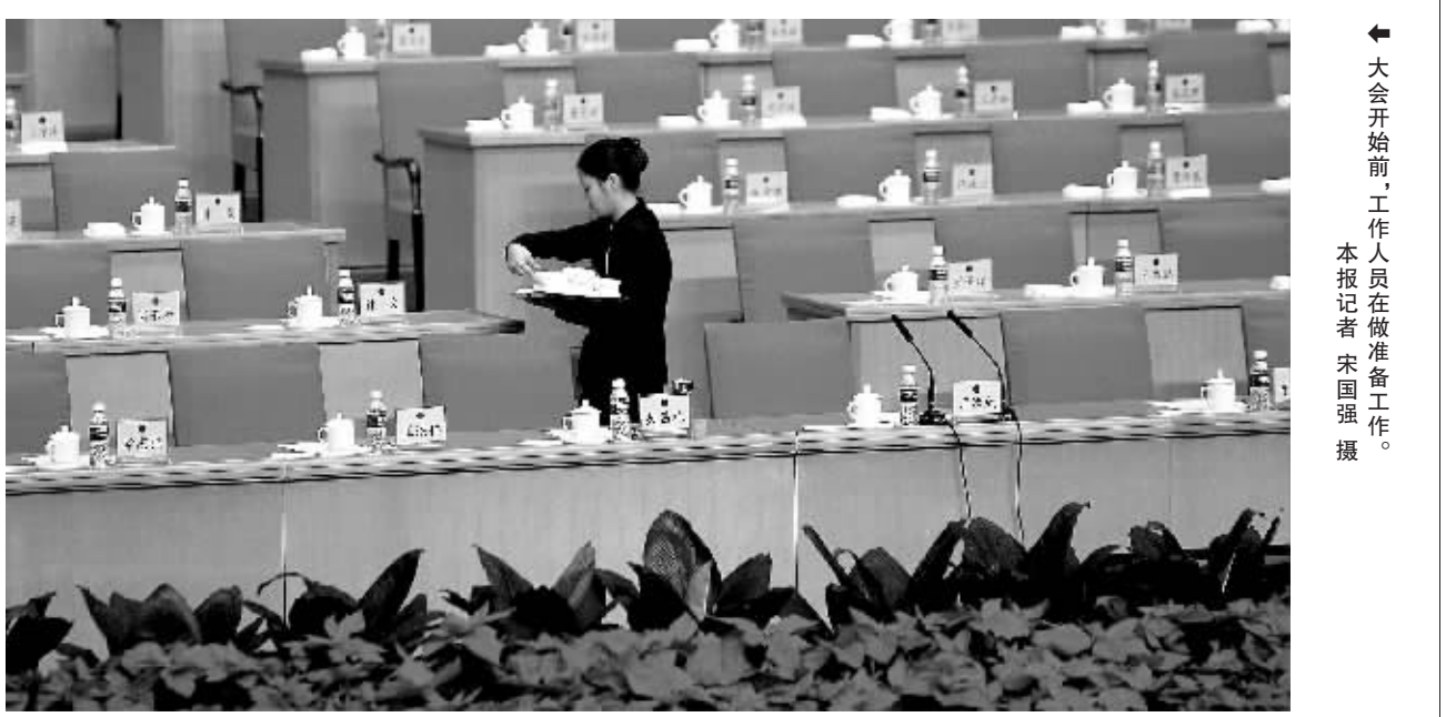
大会开始前，工作人员在做准备工作。