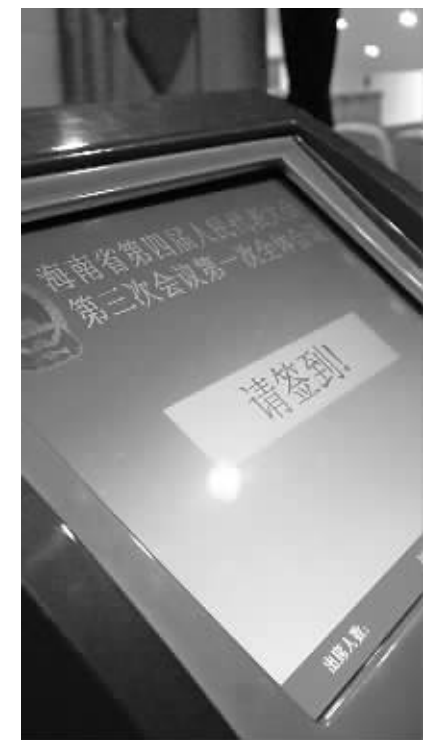
智能签到系统，代表们佩戴出席证经过入口感应设备时，就可以识别身份显示签到。智能签到系统最大的好处就是减少了人力，同时一目了然，便于人数统计。