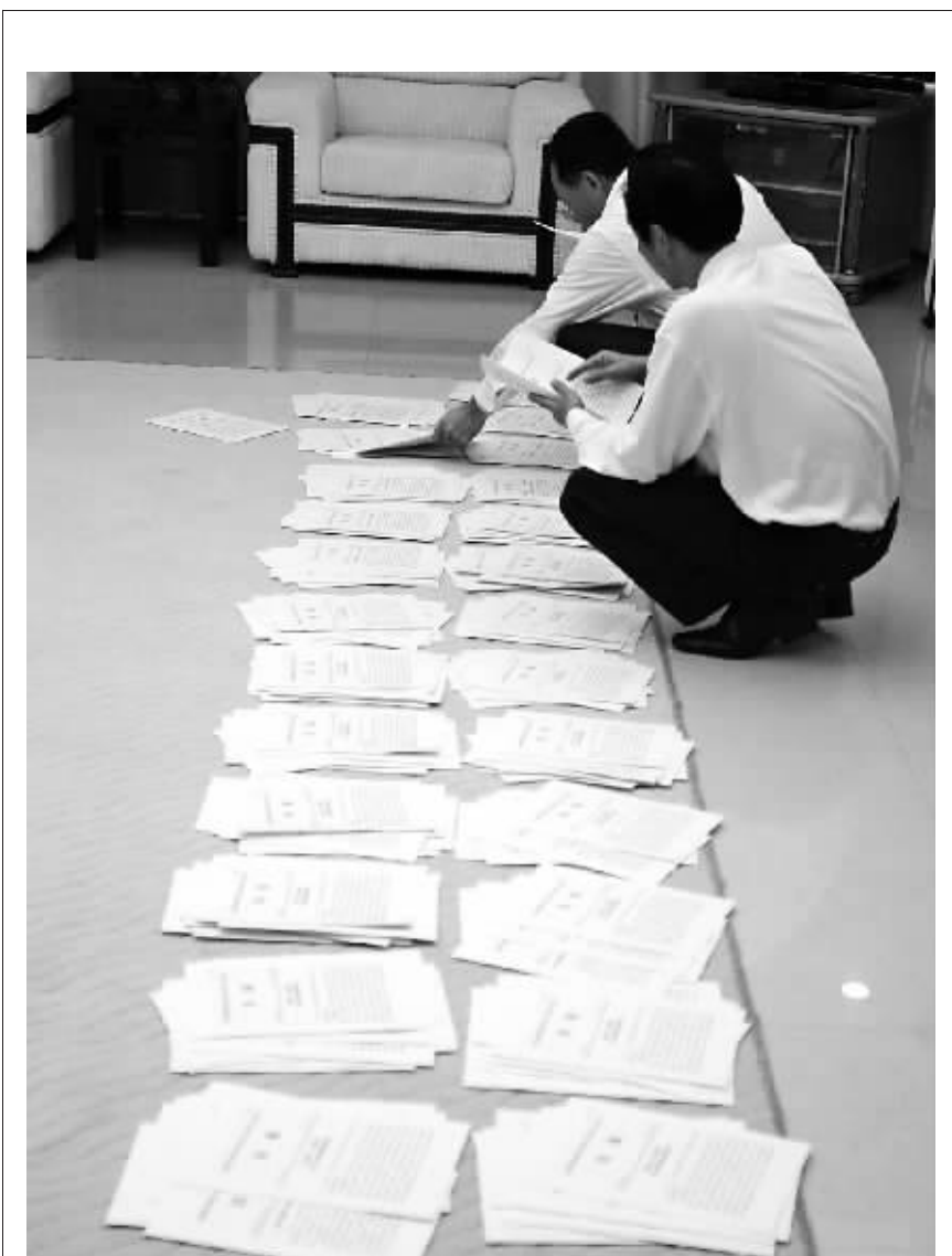
琼海团工作人员正在分发会议简报。

朱东海表示，海口市计划将2010年作为绿色工业年。在促进现有企业加大科技改造力度、减少污染的同时，利用优惠政策和资金扶持更多的高新技术企业。