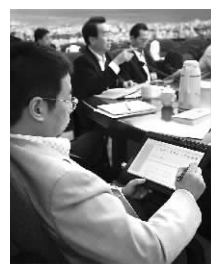
图为人大代表在笔记本电脑上手写输入其他代表发言。