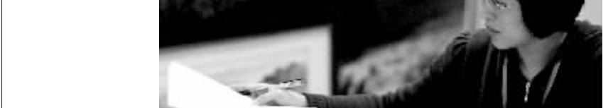
议案组工作人员在整理议案和建议。