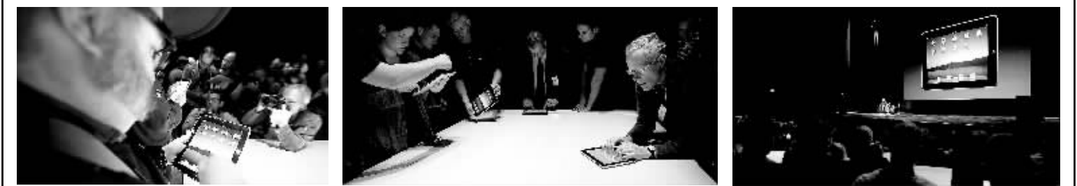
1月27日,苹果公司在美国旧金山举行最新产品iPad发布会。与会者在新产品发布会上体验iPad。

美国苹果公司27日正式发布备受瞩目的平板触屏电脑iPad,称其为介于智能手机和笔记本电脑之间的第三代移动电子产品。 业内分析称,iPad功能强大,或将取代笔记本电脑。但持不同观点者认为,iPad特点并不鲜明,称不上新一代电子产品。