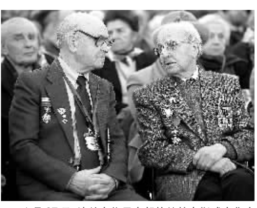
1月27日,波兰在位于南部的纳粹奥斯威辛集中营遗址举行仪式,纪念集中营解放65周年。奥斯威辛集中营是纳粹德国在第二次世界大战期间在波兰境内设立的最大的集中营,包括大批犹太人在内的约110万人被杀害。图为曾参与解放奥斯威辛集中营的苏联红军老兵交谈。