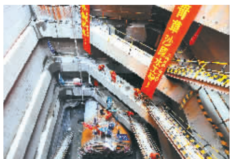
上海青草沙长江过江管

据新华社北京2月4日电(记者罗沙、韩洁)记者4日从财政部获悉,为支持春耕生产,中央财政于2月4日预拨种粮农民直接补贴资金867亿元,其中粮食直补资金151亿元,农资综合补贴资金716亿元。