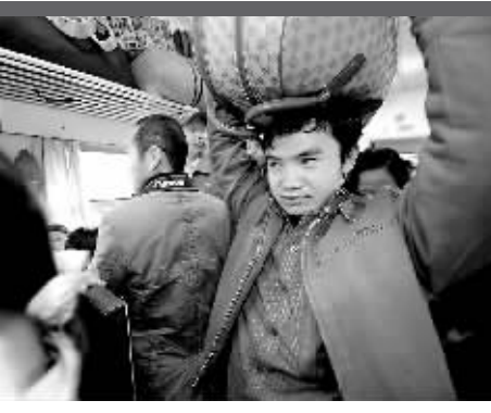
↑2月5日，一位旅客头顶行李走在车厢内。