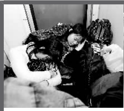
↑2月4日，旅客在车厢走廊枕着行李入睡。

新华社北京2月7日电 中国国家主席胡锦涛与哥伦比亚总统阿尔瓦罗·乌里韦·贝莱斯7日互致贺电，热烈庆祝两国建交30周年。 胡锦涛在贺电中说，自上世纪80年代两国建交以来，双边关系顺利发展。特别是近年来，中哥关系进入快速发展的新阶段。双方高层交往频繁，各领域交流合作成果丰硕，在国际组织和多边机构中也保持良好合作。中方赞赏哥方在台湾、涉藏等问题上坚持一个中国原则，理解和支持哥方为实现国家稳定和发展所做的努力。中哥两国经济互补性强，合作潜力巨大。中哥友好 与合作不仅给两国人民带来了实惠，也为中拉关系发展注入了新的活力。中国政府高度重视发展中哥关系，愿同哥方一道，不断增进相互了解和友谊，着力深化各领域务实合作，推动中哥友好合作关系又好又快向前发展。 乌里韦在贺电中说，近年来，哥伦比亚和中国的关系不断加强，高层互访频繁，双边贸易和投资与日俱增，两国经济和科技合作关系日益密切，教育和文化交流方兴未艾，在多边场合合作良好。哥伦比亚视中国为亚太地区主要战略伙伴之一，愿进一步加强两国友好合作，促进共同发展。