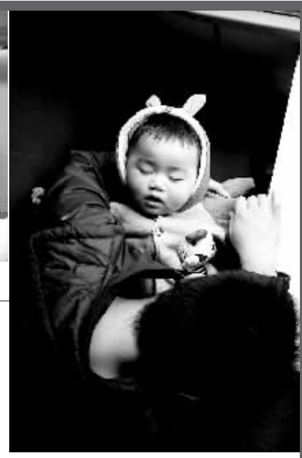
↑2月6日，在浙江杭州开往安徽池州的5122次列车上，一名不满2岁的男孩在父亲的怀抱里睡觉。