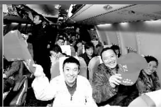
↑2月6日，川籍籍在泉优秀农民工在返乡的飞机上。