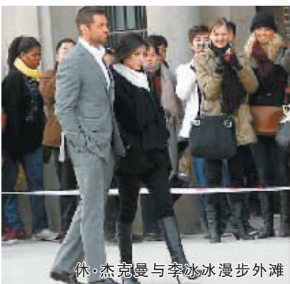
休·杰克曼与李冰冰漫步外滩

西农村与现代上海两个交错的时空背景，展现不同时代中国同龄女性义结金兰的故事。片中还将特别展现濒临失传的中国非物质文化遗产——湖南“江永女书”。