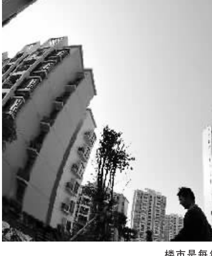
表示,目前实体经济的投资信心尚在恢复之中,股市、楼市的资产价格快速上升具有更强的诱惑力,部分资金会以各种方式进入股市和楼市,助推资产价格上涨,从而直接影响到对实体经济的支持。