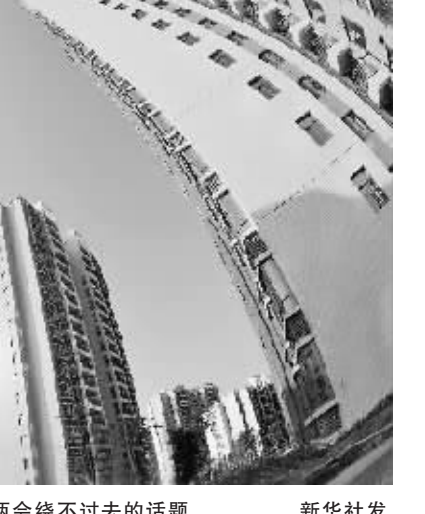
事实上,除了购房对消费支出的挤出效应,过高的房价也令许多人望而却步,一些政协委员指出,如果民众根本买不起房,那么通过房地产来拉动相关产业的消费便成了一句空话。