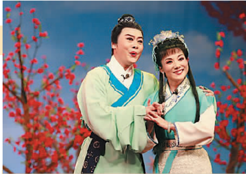
张辉(左)在黄梅戏《天仙配》中

本报海口3月3日讯 (记者卫小林)首届梅兰芳国际旅游论坛开幕在即,两场经典黄梅戏剧目展演,将于3月15日和16日晚在海口人大礼堂隆重演出,为首届梅兰芳国际旅游论坛献礼,这是海南日报记者今天从演出承办方海南中唱文化传媒公司获悉的。据介绍,这场名为“天邑国际之夜”的黄梅戏经典剧目展演,被赋予了“天邑迎春·黄梅报喜”的主题。此次展演,将献上中国观众十分熟悉的《女驸马》和《天仙配》两大经典黄梅戏名剧,为海南观众带来中国戏曲名剧迷人的艺术魅力。记者了解到,担纲本次演出任务的湖北省黄梅戏剧院是我国一流的艺术剧团,多年来,该院创作演出了不少优秀黄梅戏电影、电视剧和舞台作品,如黄梅戏影片《血泪恩仇录》,黄梅戏电视剧《貂蝉》、《夷陵好人》,黄梅戏舞台剧《天仙配》、《女驸马》、《未了情》、《和氏璧》、《双下山》、《冬去春又回》等,曾经荣获多项国家级大奖,包括电视剧《貂蝉》获得的全国电视剧“飞天奖”,《未了情》获得的“文华新剧目奖”、“文华导演奖”、“文华音乐奖”、“文华表演奖”,《双下山》获得的首届全国黄梅戏艺术节一等奖等等。该剧院曾多次出访海外,在英国、德国、法国、芬兰、乌克兰、土耳其、印度、新加坡、马来西亚、韩国等国家和中国台湾、香港等地区,所到之处都深受观众欢迎。演出策划方告诉记者,本次演出由国家一级演员、素有“中国黄梅戏第一小生”之称的张辉领衔主演。作为“中国黄梅戏第一小生”,张辉是中国戏剧最高奖梅花奖的获得者,曾三次登上央视春节联欢晚会舞台,与我国著名黄梅戏演员马兰、韩再芬、吴琼等联袂献艺,让全国观众都领略了他的艺术风采。这次来琼演出,也是张辉携湖