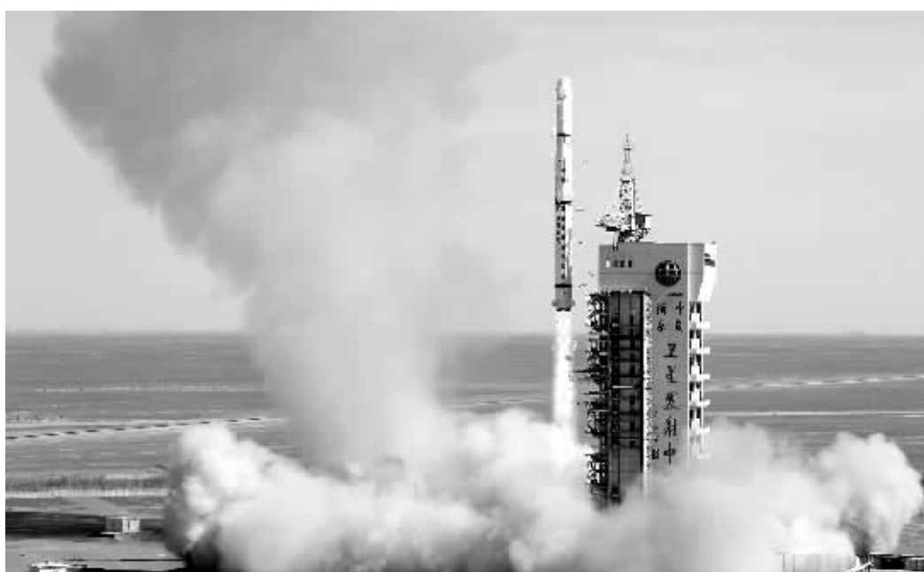
3月5日12时55分,我国在酒泉卫星发射中心用“长征四号丙”运载火箭成功地将“遥感卫星九号”送入太空预定轨道。图为火箭发射瞬间。

用于发射的“长征四号丙”运载火箭是由中国航天科技集团公司所属上海航天技术研究院研制,这次发射是长征系列运载火箭的第123次飞行。