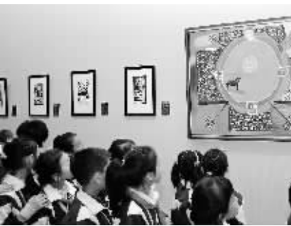
左图:11日下午,风之彩——墨西哥残疾儿童绘画展在省博开幕。右图:绘画展作品