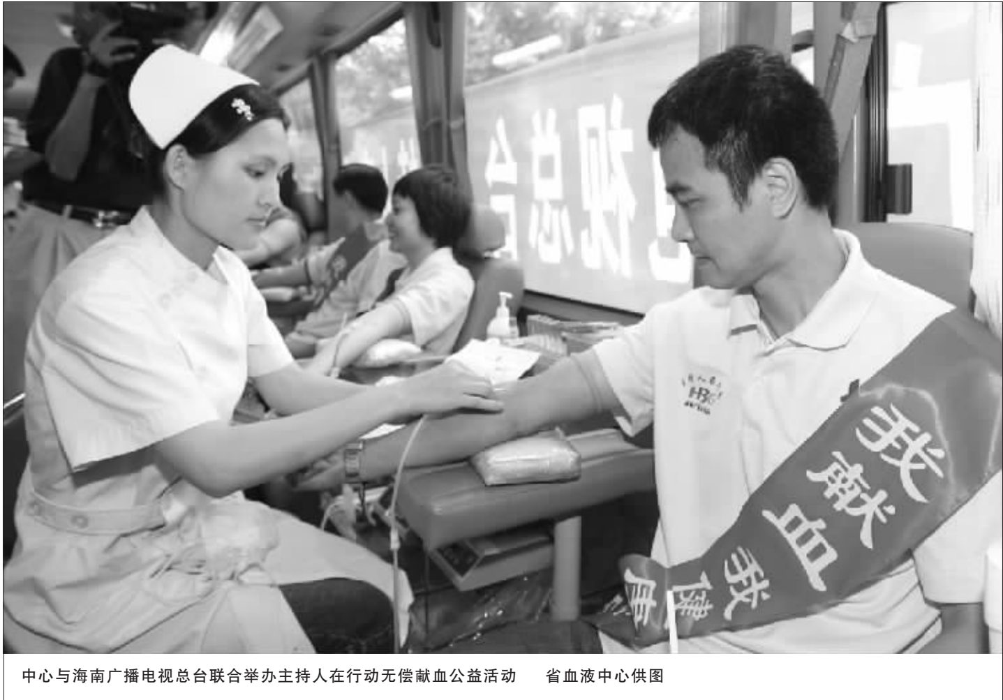
中心与海南广播电视台总台联合举办主持人在行动无偿献血公益活动

2009 年血液采集总量为 24.95 吨，机采血小板 4090U，全血分离率 98.23%，成分输血量 99.61%。迄今，全省已有 52 万人次参加无偿献血，献血总量达 141.21 吨。