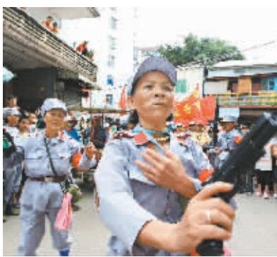
在街头表演的“老红军”。

在三亚市的南海、榆港渔村,活跃着一支“老红军”演出队伍。每逢休渔期或渔家喜庆节日,这群由老渔民组成的“红军”队伍,便走上街头演出,她们的演出深受渔村男女老少的喜爱。