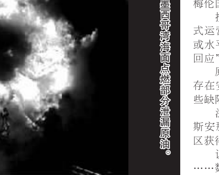
美国在墨西哥湾海面的一座钻井平台发生爆炸。

国土安全部部长珍妮特·纳波利塔诺等多名出席汇报会的政府高官强调,租用“深水地平线”的英国石油公司是这起事故“责任方”,应为清理泄漏原油“埋单”。 汇报会后,布赖斯-奥哈拉与纳波利塔诺一同出席新闻发布会。前者说,浮油将于30日漂至墨西哥湾三角洲地区;后者则称漏油事故具有“全国意义”,这一表述意味着全美各地运至灾区的人员和设备将享受优先通行待遇。 奥巴马随后在白宫发表讲话,要求政府利用包括军方在内的“每一个可用资源”应对漏油事故。他说,已命令内政部长肯·萨拉萨尔、环境保护署署长莉萨·杰克逊以及纳波利塔诺30日前往墨西哥湾沿岸地区,确保“英国石油公司”和美国政府动用一切力量应对这一事件并查明原因。