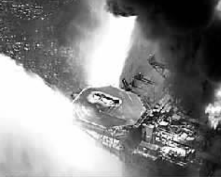
美国在墨西哥湾海面的一座钻井平台发生爆炸。

路易斯安那州州长博比·金德尔29日在首府巴吞鲁日签署声明,宣布全州进入为期一个月的“紧急状态”,调动州内资源并寻求联邦政府援助,以应对“路易斯安那州沿海地区受到的石油(泄漏)影响”。声明说,泄漏原油扩散尚未得到遏制,“天气和环境状况加速石油扩散”。美国国家海洋和大气管理局发言人查尔斯·亨利29日说,部分浮油距离路易斯安那州海岸大约4.8公里。奥巴马当天与墨西哥湾沿岸5个州州长通电话并在白宫听取关于原油泄漏情况的汇报。美国海岸警卫队少将萨莉·布赖斯-奥哈拉在汇报会上说:“我们正采取积极措施,已准备好应对最糟糕状况。” 油井每天泄漏5000桶原油 美国内政部部长戴维·海斯则在会上说,油井每天泄漏5000桶原油,以打减压井方式止漏还需90天。政府不排除暂停建设新海上钻井平台的可能性。