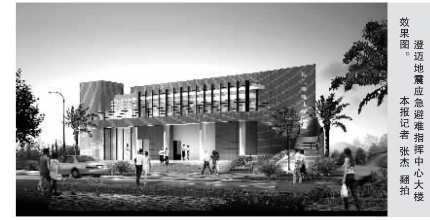
澄迈地震应急避难场所指挥中心效果图。

据“综合规划、平灾结合、因地制宜、一所用多、就近疏散、安全与通达”的地震应急避难场所建设原则，这里将建设成为全省示范性的应急避难场所。 澄迈县金江镇是该县政治、文化、交通、商贸中心，县城总人口7万人，居住较为密集。金江地势北高南低，又处南渡江流域，一旦发生地震、洪水等重大自然灾害，将对该地区造成极大破坏，产生大量需要疏散和避难的群众。选址绿地广场作为澄迈县第一个避难场所，经过了国家地震局、省地震局有关领导和专家的实地考察后确定，并通过了省抗震救灾指挥部办公室组织相关专家评审。