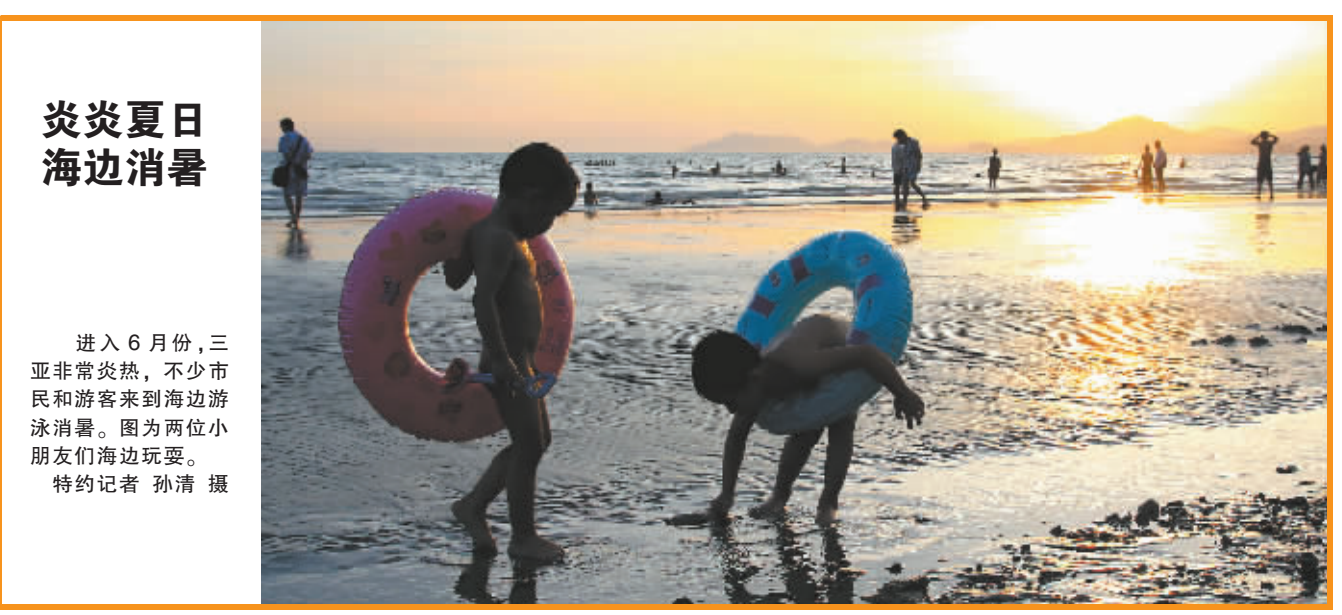
进入6月份,三亚非常炎热,不少市民和游客来到海边游泳消暑。图为两位小朋友们在海边玩耍。