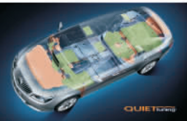
隔音降噪QuietTuning静音科技