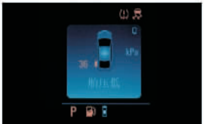
全系标配PMS智能胎压监测系统