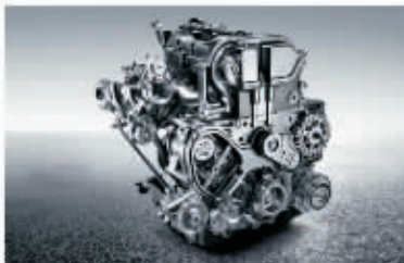
2.0L Turbo DI直喷涡轮增压发动机

在内饰方面,新君越也同样采用了新君威的设计,采用先进的座椅设计,兼顾运动性能与舒适安全的双重需求。全车标配独立双区全自动高效空调系统,可以智能调节出风量及温度、湿度。此外,40英寸宽屏触控导航系统、E-Touch多媒体控制系统、EPB电子手刹系统、智能无钥匙进入及一键启动功能均出现在新君越上。