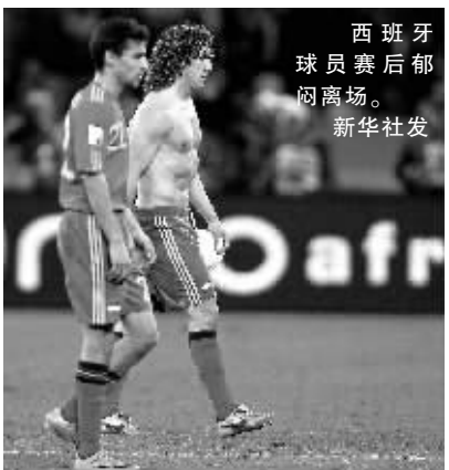
西班牙球员赛后郁闷离场。

在16日凌晨进行的G组一场引人瞩目的比赛中,夺冠热门巴西队以2:1击败“神秘之师”朝鲜队。朝鲜队虽败犹荣,他们坚韧的精神和成熟的技战术能力令人称道。