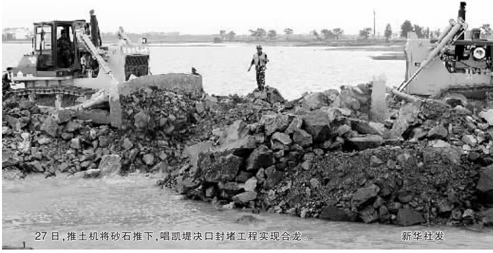
27日,推土机将砂石推下,唱凯堤决口封堵工程实现合龙。

唱凯堤所在的当地政府抚州市、临川区大力提供物资保障,先后在决堤附近开辟土料场和石料场,数百辆卡车川流不息,夜以继日往河里堵口处倾泻土石料。为降低决口处水位,抚河上游洪门水库26日已关闸,廖坊水库减少下泄流量。26日,江西省财政厅、水利厅紧急拨付2300万元用于唱凯堤复堤堵口工程。