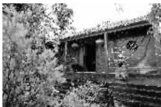
阳江镇上的圣娘庙。1928年2月，中共琼崖第二次代表大会在这里召开。