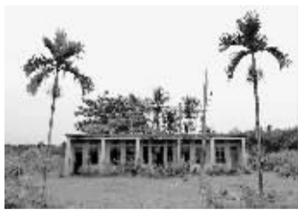
解放后在琼崖高级列宁学校旧址上修建起了土地岭小学。

根据琼崖特委指示，乐四区苏维埃政府在岭脚村办了一所红军医院。在敌人封锁的恶劣环境下，这所医院内中、西、草药一应俱全。草药山中就地采集，革命群众、进步华侨千方百计支援中西药品，红军医院为战事服务发挥了重要作用。