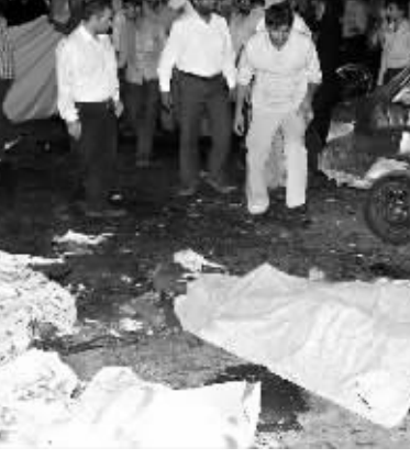
扎黑丹市在爆炸中丧生。他谴责这起爆炸事件,认为这是“恐怖行径”。目前尚没有一个组织声称对这起事件负责。

伊朗内政部负责安全事务的副部长阿卜杜拉赫曼当天向伊朗半官方的法尔斯通讯社说,这是一起自杀式爆炸事件,多名革命卫队高级军官在爆炸中丧生。他谴责这起爆炸事件,认为这是“恐怖行径”。目前尚没有一个组织声称对这起事件负责。