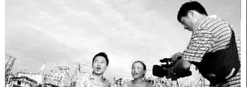
7月20日，在临高县调楼港，影视工作人员正在拍摄歌唱“哩哩美”短片。届时，第四届渔文化节开幕式及文艺晚会上将播放这些具有浓厚鲜明特色的“哩哩美”渔歌短片，向各位来宾展示渔家丰富的精神文化生活。