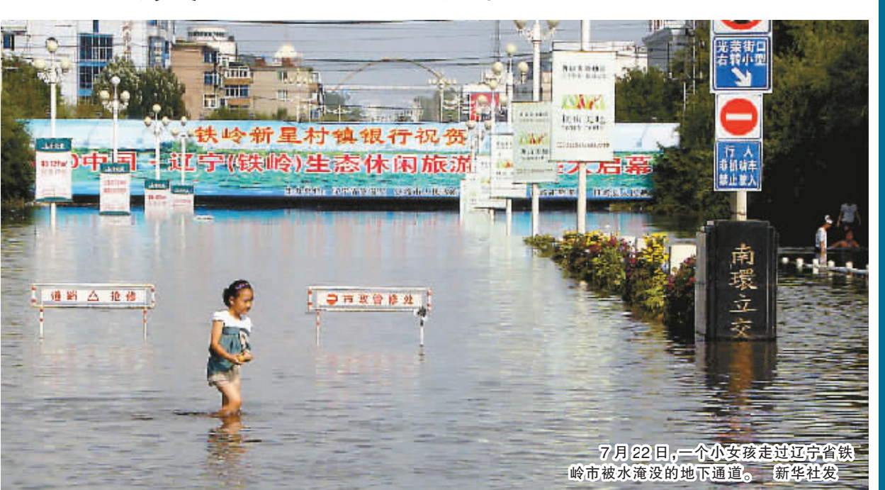
7月22日,一个小女孩走过辽宁省铁岭市被水淹没的地下通道。

据新华社北京7月22日电(记者姚润丰)记者22日从国家防汛抗旱总指挥部获悉,受强降雨影响,辽河干流和部分支流发生超警戒洪水,松花江支流伊通河发生超保洪水。长江上游干支流河道水位已退至警戒水位以下;干流中游利至城陵矶江段,九江河段以及洞庭湖、鄱阳湖继续缓涨,超警幅度0.23至0.54米,较21日8时上涨0.02至0.19米。太湖水位缓落,淮河上游洪峰通过王家坝。