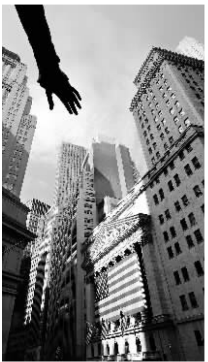
7月21日,在美国纽约华尔街,华盛顿雕像的手臂指向晨光中的纽约证券交易所。