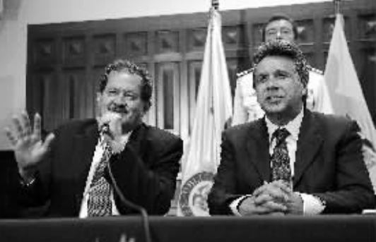
7月22日,哥伦比亚当选副总统安赫利诺·加尔松(左)在厄瓜多尔首都基多出席新闻发布会。