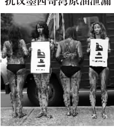
7月22日,在墨西哥首都墨西哥城,动物保护组织成员抗议墨西哥湾原油泄漏事件。在墨西哥湾漏油事件发生3个月后,英国石油公司7月15日宣布,新的控油装置已成功罩住水下漏油点,“再无原油流入墨西哥湾”。