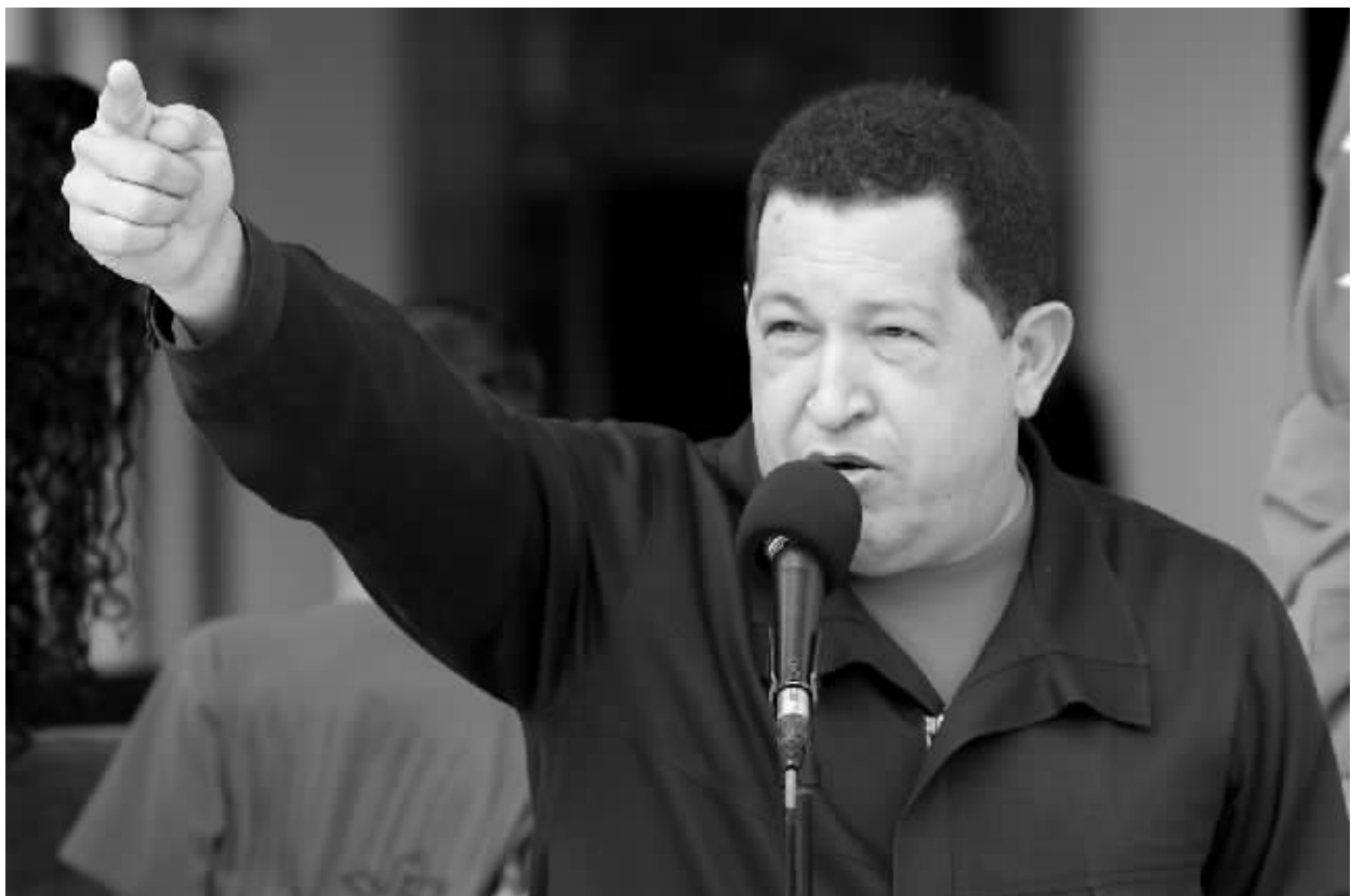
7月22日,委内瑞拉总统查韦斯说:“出于尊严,我们别无选择,只能断绝与哥伦比亚的外交关系。” 新华社发

委内瑞拉与哥伦比亚因“庇护哥伦比亚反政府武装头目”指控发生的争端22日升级:委内瑞拉总统乌戈·查韦斯当天宣布与哥伦比亚断交。 这两个安第斯山脉国家双边关系陷入高度紧张,但政治分析人士认为不可能爆发战争,两国关系待哥伦比亚当选总统胡安·曼努埃尔·桑托斯就任后仍可能回暖。