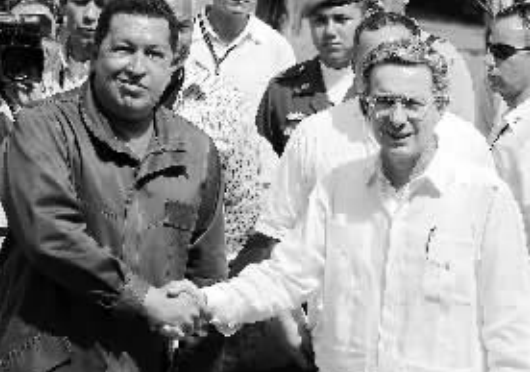
这是2009年1月24日委内瑞拉总统查韦斯(左)与哥伦比亚总统乌里韦在哥伦比亚卡塔赫纳握手。