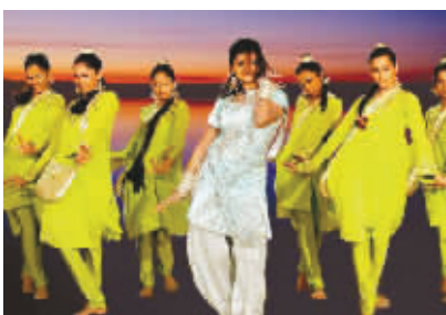
印度宝莱坞歌舞团演出照

本报海口7月23日讯 (记者蔡葩)今年是中印两国建交60周年。记者昨天从省国际文化交流中心获悉，作为建交庆典活动内容之一，海南省文化广电出版体育厅、海南省国际文化交流中心联合举办的“印度宝莱坞歌舞团”访问海南演出活动，将于7月28日、30日分别在海口、三亚举行。