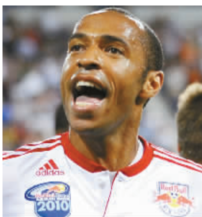
23日，亨利攻入加盟美国职业足球大联盟后的首粒进球。