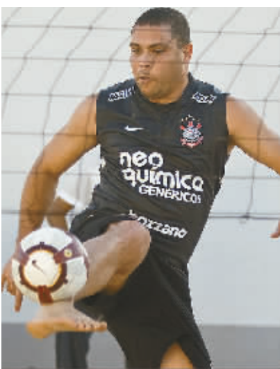
23日，罗纳尔多在休养两个多月后恢复体能训练，备战25日举行的巴西全国甲级联赛第11轮比赛。