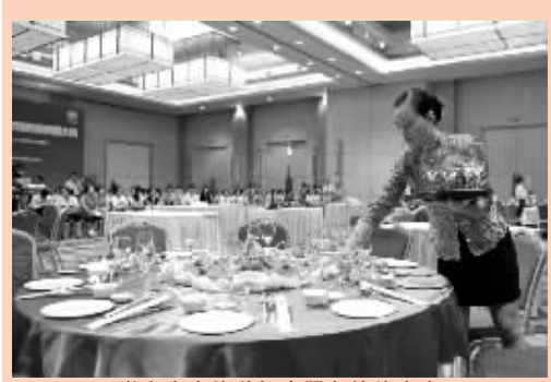
举办全省旅游饭店服务技能大赛