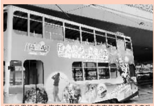
“在世界行走,为海南停留”香港电车宣传正式启动