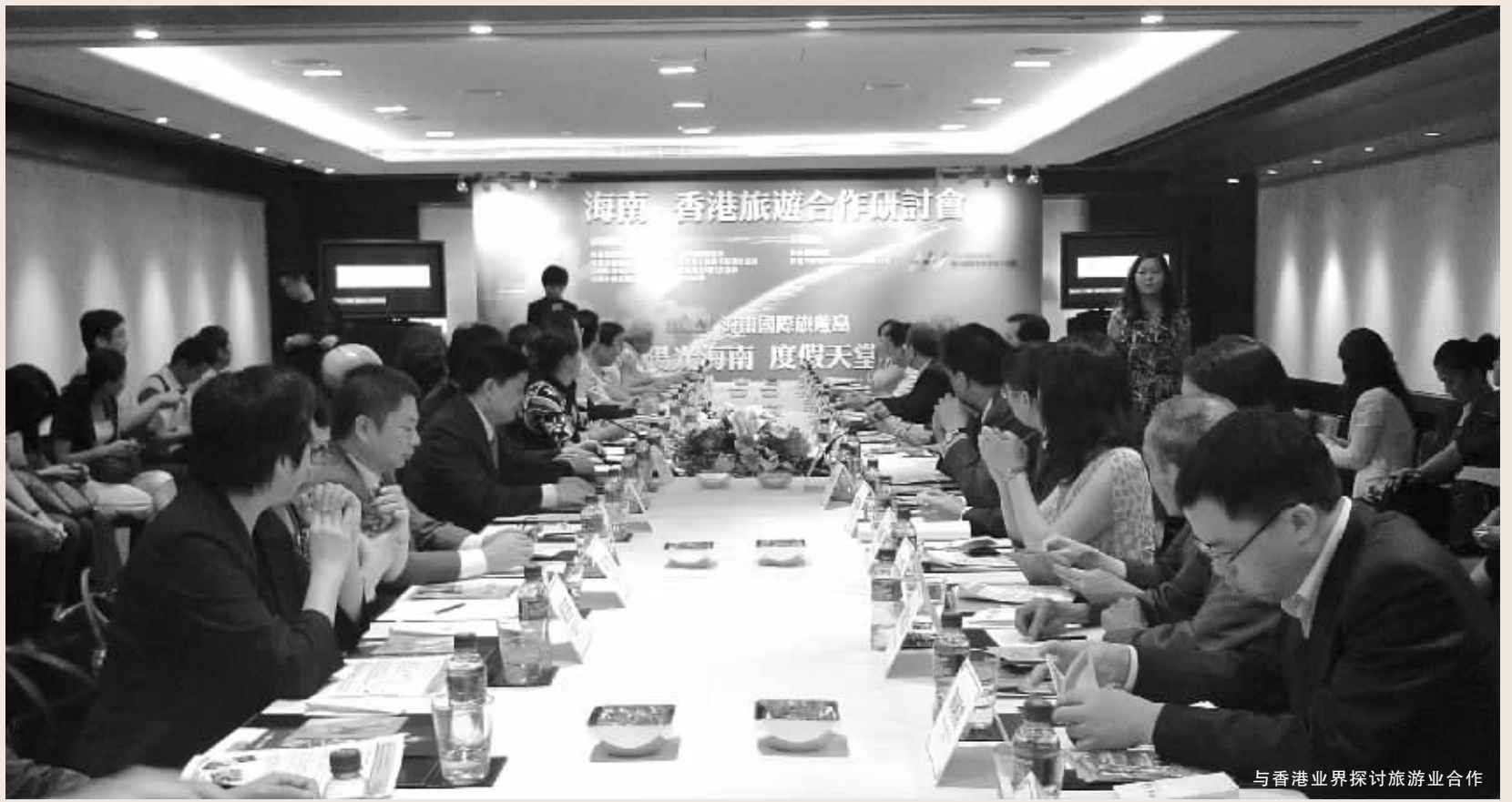
与香港业界探讨旅游合作

建设国际旅游岛,要从一点一滴认真做起。7月28日开始,省旅游委全委上下专门就本次“两广”考察的收获展开了大学习、大讨论,希望将“两广”精神转化为国际旅游岛建设的动力,将“两广”经验转化为国际旅游岛建设的成果。并结合各自实际工作,提出了许多化经验为实践的好建议和好想法。