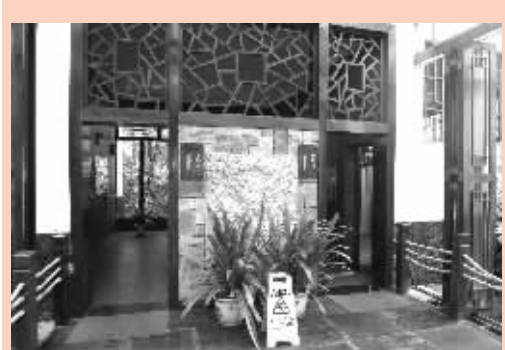
提升旅游景区厕所管理和服务水平

设环境综合整治工作的总体部署,继续深入开展旅游市场综合整治工作,依法查处旅游市场违规行为,规范旅游市场秩序。