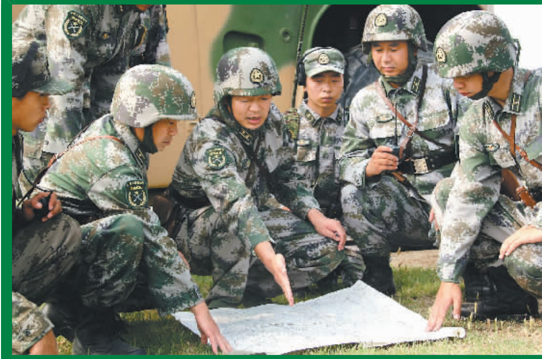
↑参演的济南军区某防空部队指挥人员在“作战地域”明确任务。