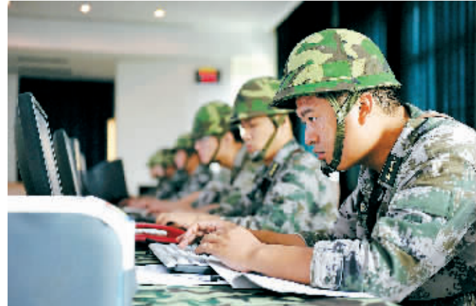
↑参演的某预备役高炮部队官兵正在紧张作业。