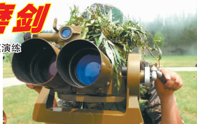
↑参演的士兵侦测“敌机”坐标后指示给炮阵地。

这次演练飞机将飞行近百批、200余架次，实际模拟敌空中行动，展开陆军防空导弹、高炮等7种主战对空火器，进行空地对抗演练。（据新华社济南电）