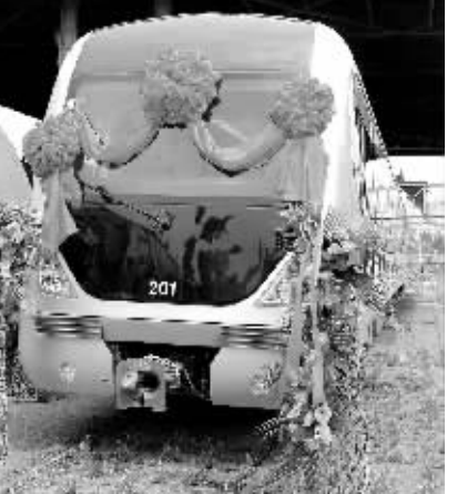
8月6日,天津地铁2号线首列车在中国北车集团大连机车车辆有限公司下线,该公司为天津制造的不锈钢车体地铁车辆开始批量交付。