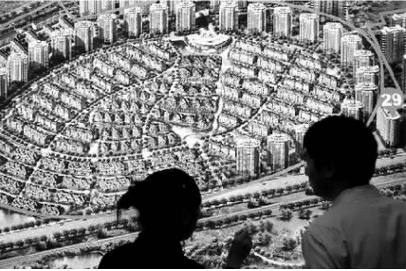
被称为政府“利剑”的土地闲置“两年大限”规定几成“一纸空文”,不仅破坏了法律法规的尊严,伤害了政府的信誉,也侵犯了第三方的利益和公共利益(资料照片)。

泛海建设集团股份有限公司在北京繁华地带购置的4块地闲置6年,期间5次调整建设规划。据估算,在这6年期间开发商仅靠收土地和房地产自然增值的利润就超过200亿元。人们质疑,泛海建设以“规划调整”为借口“捂地”获取暴利,并逃避相关的监管、查处。