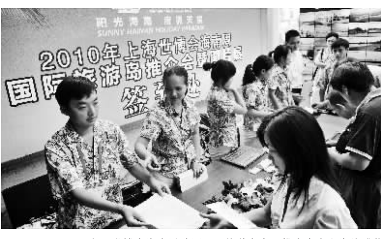
8月8日下午，世博会海南活动周国际旅游岛专项推介会在上海外滩茂悦大酒店举行。