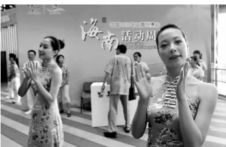
8月8日，美丽的海南姑娘们热情欢迎各地嘉宾。