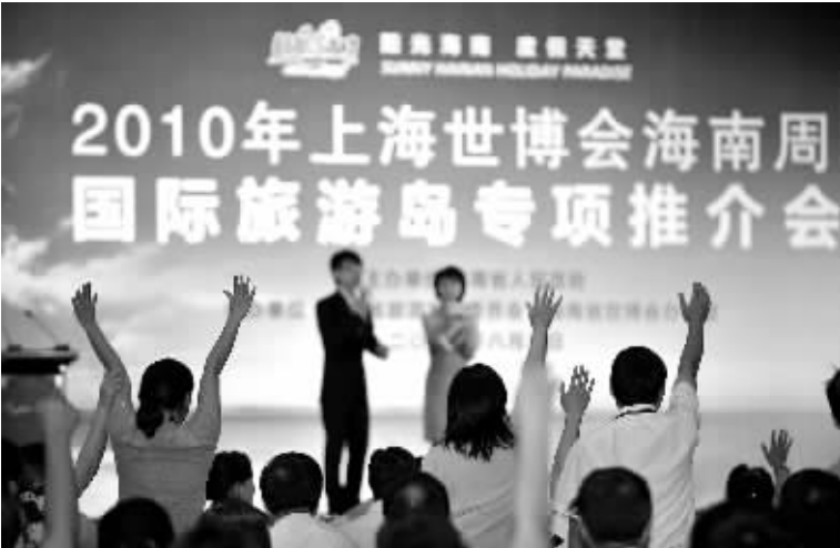
8月8日，与会的上海旅游企业代表争相抢答主持人提出的有关海南旅游的问题。